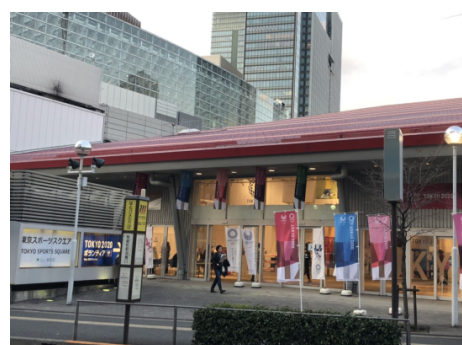
「東京スポーツスクエア」外観