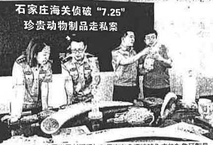
2017年8月、中国当局が押収した日本から違法輸入された象牙製品

中国のメジャーは4月半ば、ウルムチの税関が中国国内の11の異なる象牙密輸ネットワークを露した。昨年、日本から、おもちゃとして送られた象牙の中に、象牙の加工が入っているのを発見したのがきっかけで、日本に仕入れている象牙のほとんどが、中国に送られた。