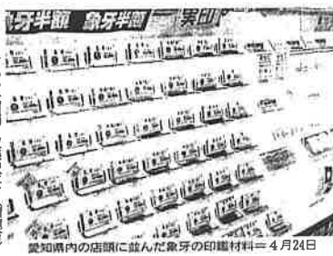
愛知県内の店頭に見られた象牙の印刷材料＝4月24日

（W）E）ジャババ 密猟前に手に入れた象牙を、密猟者が密猟現場で象牙を加工して象牙製品を製造している。象牙製品は象牙の密猟を助長している。象牙製品は象牙の密猟を助長している。象牙製品は象牙の密猟を助長している。 象牙製品は象牙の密猟を助長している。象牙製品は象牙の密猟を助長している。象牙製品は象牙の密猟を助長している。 象牙製品は象牙の密猟を助長している。象牙製品は象牙の密猟を助長している。象牙製品は象牙の密猟を助長している。