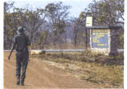
アフリカ南部ザンビアのカフエ国立公園で、象を餌にハトロールするレンジャー＝2018年8月（共同）

太陽が傾きかけたSAPUのキャンプで別れ際にムサダはこう言った。「日本でまだ、象牙を合法的に売っているとは知らなかった。僕がそれを知らないように、日本人々も本当のアフリカゾウのことを知らないだろう。ぜひ、野生のゾウを見にここに足を運んでほしい」（敬称略、文・井田徹治、写真・中野智明）