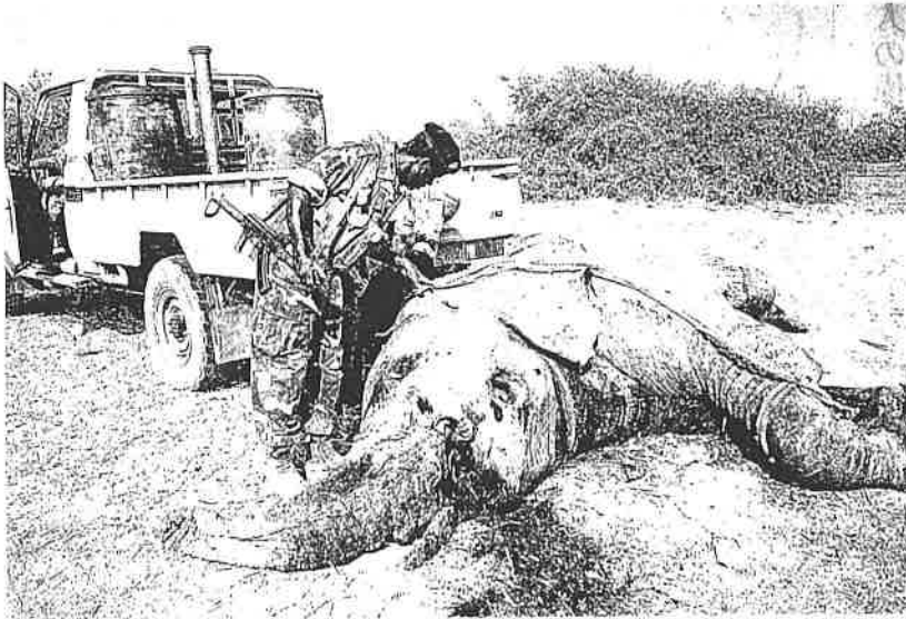
密猟者に殺されたゾウの死骸を調べる担当者＝チャドの国立公園

象牙目当てのアフリカゾウの密猟が依然として深刻だ。最大の消費国だった中国に次ぎ、英国も国内市場を閉鎖する中、英国の取引が自由な日本に厳しい目向けられている。次のワシントン条約締結国会議でもこの問題は重要議題になる。アフリカゾウ保護と象牙取引の最新状況を追った。