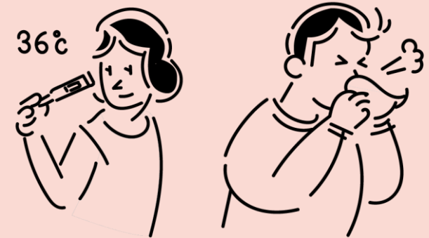
無症状・軽症者からの感染も