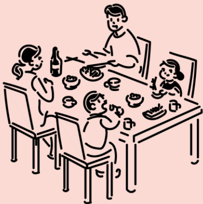
主な感染経路は「家庭内」や「会食」