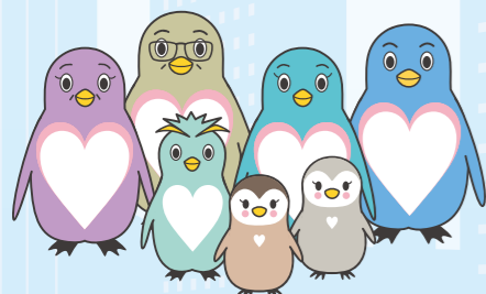
東京都里親制度普及啓発キャラクター 「さとべん・ファミリー」

ペンギンは子煩悩な動物で、オスとメス、群れで協力してヒナを守り、子育てをします。 ペンギンのコミュニティがヒナを守り育てるように、里親制度においても、里親や社会が 手を取り合いながら子育てをしていくこと、里親がごく普通のこととして受け入れられる ような社会になるようにという願いを込めています。